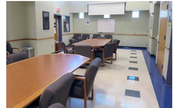
Área de visitas

Preferimos que una vez que esté adentro se quede adentro durante toda la visita. Si tiene que salir por cualquier razón, tendrá que pasar por el detector de metales otra vez cuando vuelva a entrar.